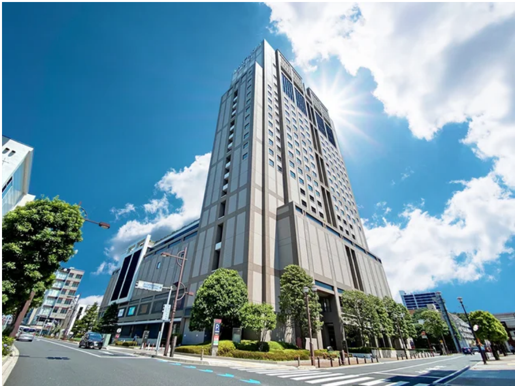
ロイヤルパインズホテル浦和